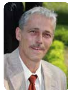
Georges Lafontaine French translation / Traduction en français