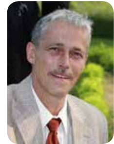
Georges Lafontaine French translation / Traduction en français